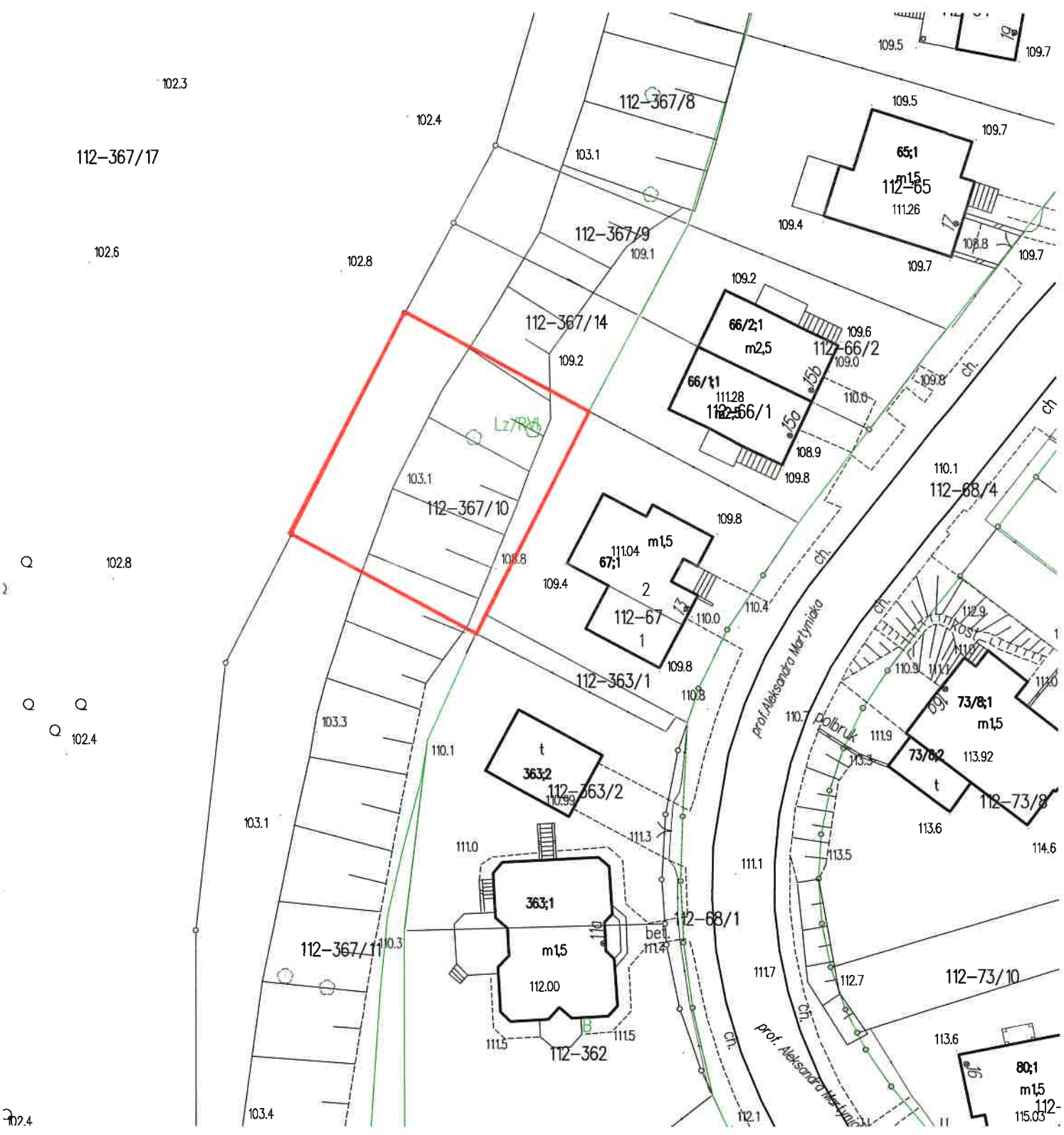
Załącznik nr 1 do Uchwały m. Olsztyn ul. prof. Aleksandra Martyniaka obr. 112 dz. nr 367/10